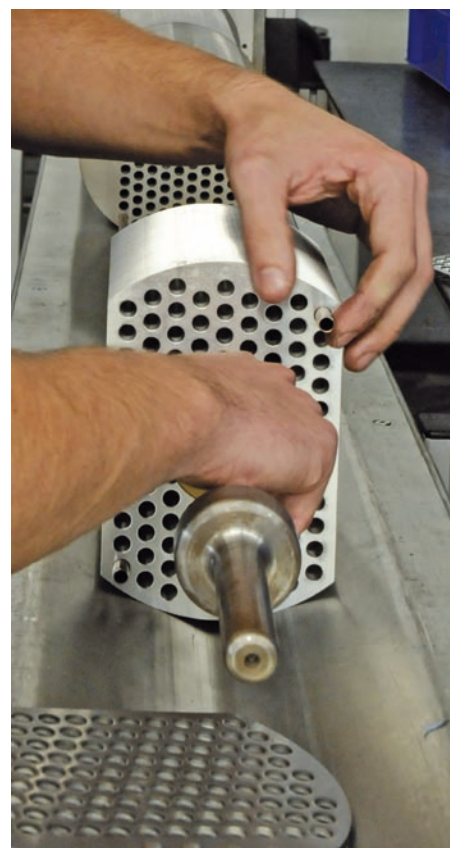
3: Fertigung mit Lamellen

Durch das breite Produktportfolio, zu dem auch komplette Schlauchleitungen, Rohrleitungen, Kugelhähne, Armaturen, Adapter und Verschraubungen gehören, ist Dietzel Hydraulik in der Lage, Wärmetauscher-Komplettvarianten anzubieten. Vollständige Verrohrungen und/oder Verschlauchungen aus unterschiedlichen Materialien (Stahl, Edelstahl, Kunststoff) sind problemlos möglich. Spezielle Einbausituationen werden im Kundengespräch vor Ort analysiert und die Bauweise des Wärmetau-